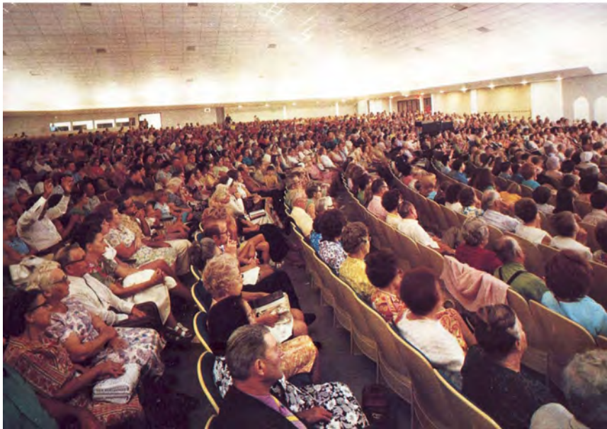
Deze preek was op 9 juli 1980 tot een live publiek in het Capstone auditorium gebracht